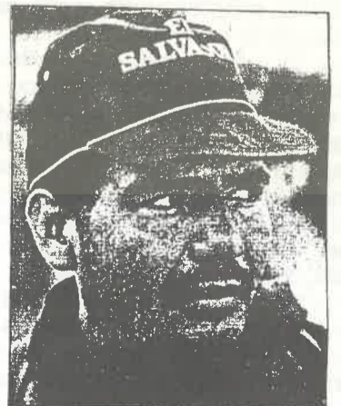
Facundo Guardado, Comandante del FMLN.

En Guatemala, la UASP (Unidad de Acción Sindical y Popular), reiteró su ayuda y solidaridad con el pueblo salvadoreño.