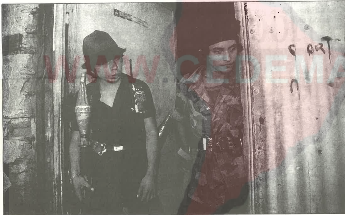
Las ofensivas del FMLN obligarán a Cristiani a negociar.

(*) Extraído de un análisis del Centro de Documentación del FMLN