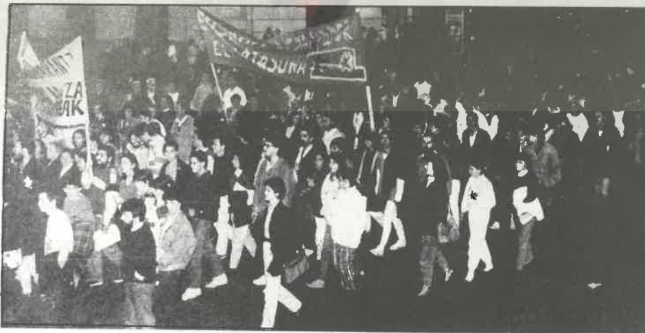
Estos días, una ola de solidaridad con el pueblo salvadoreño recorrió todos los rincones de la geografía.