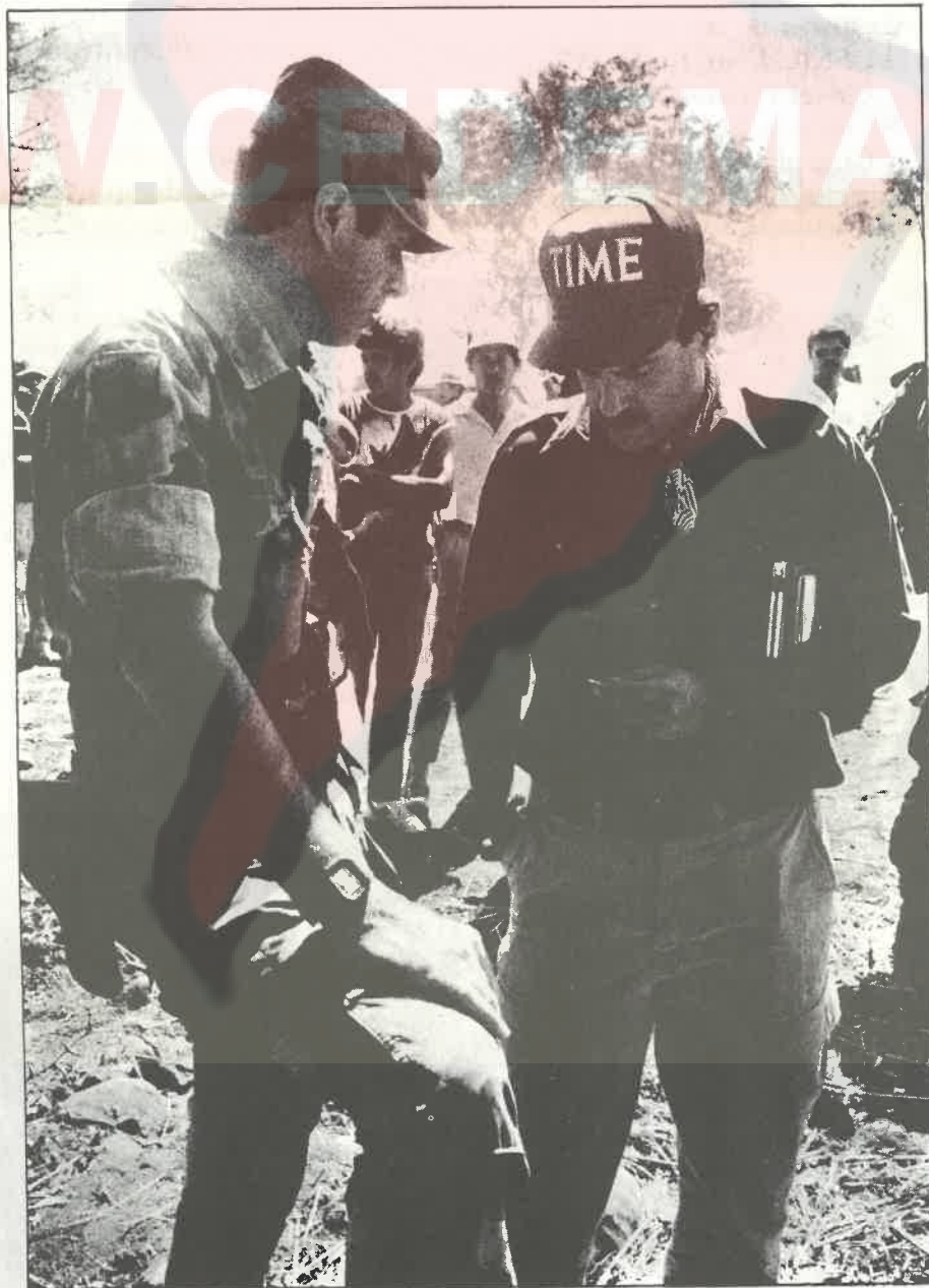
El gobierno de Bush tuvo una activa participación en la masacre que desataron las FAES. Aquí vemos un asesor norteamericano con un oficial salvadoreño.

El Estado Mayor pasó a ejecutar un nuevo plan militar sobre la parte Norte de San Salvador, precedido de la amenaza de que la FAES haría uso de