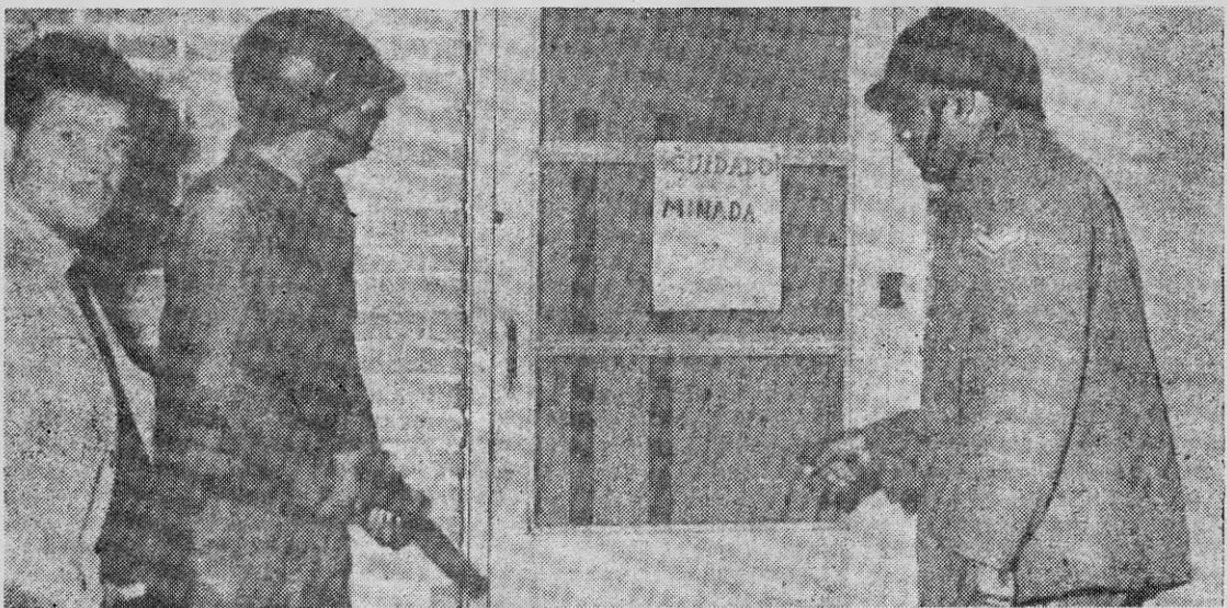
FUERZAS MILITARES llegan a una radioemisora tomada por los Tupamaros y que transmitía propaganda del MLN.

8.— Todo lo anterior, junto a razones de nuestro país, hace que debamos elaborar una