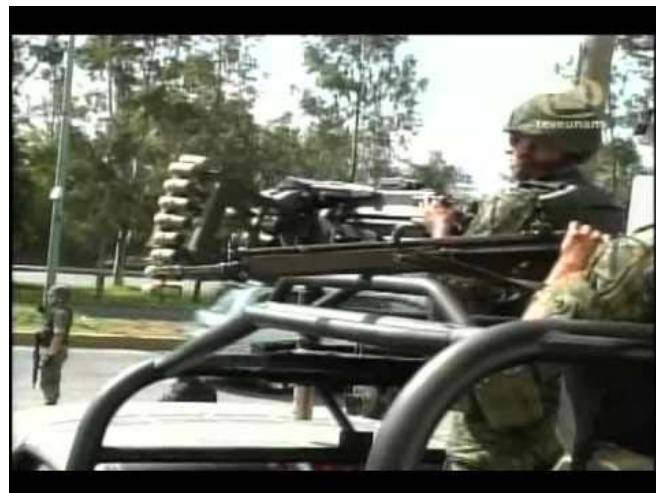
Ejército federal ejerciendo la violencia de Estado.

Usan a sus mejores cuadros públicos el Estado y la IP, para dramatizar el papel de víctimas con el que según ellos, compra el derecho para exigir la continuación de la política de criminalización de la