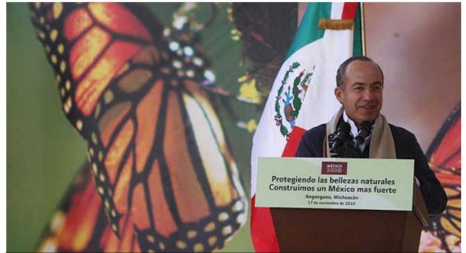
Calderón en sus discursos falaces en Michoacán

A esta quimera de desarrollo también se suma el gobernador de Michoacán, Leonel Godoy