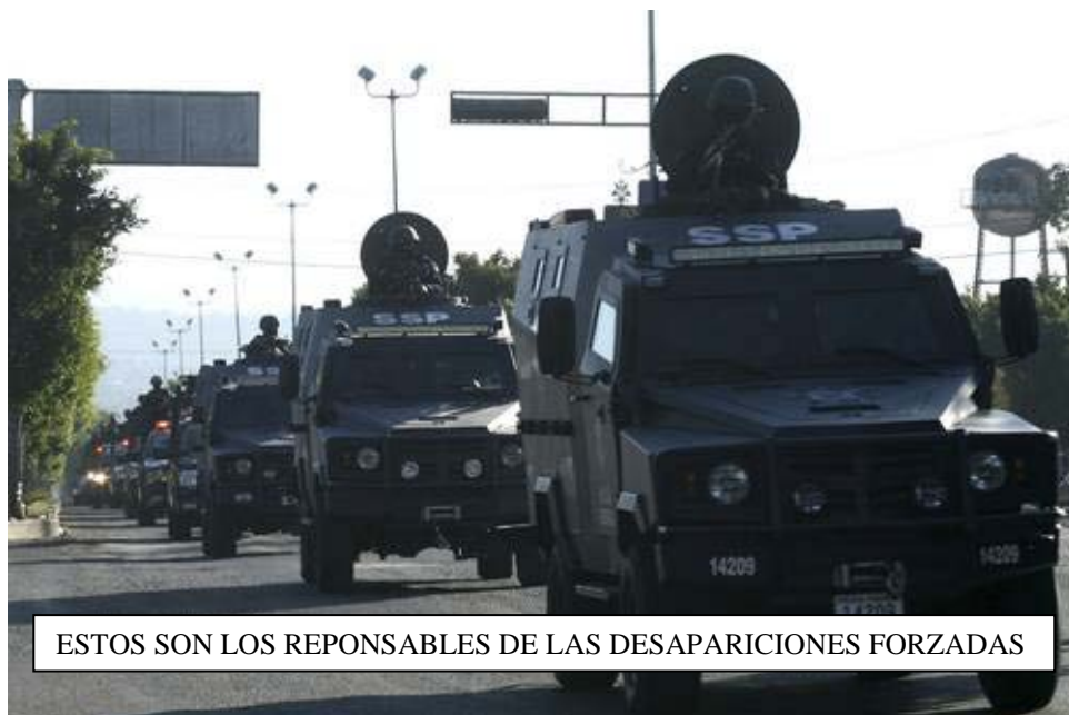
ESTOS SON LOS REPONSABLES DE LAS DESAPARICIONES FORZADAS

El ejército y la marina se han estado encargando de concretar la militarización del país con toda la cauda de violación a los derechos constitucionales que ello implica. Dentro las tareas encomendadas por su jefe supremo está la desaparición forzada de los luchadores sociales y los revolucionarios, a quienes han desaparecido con la aquiescencia del Estado, es decir, con el conocimiento y consentimiento del gobierno federal encabezado por Felipe Caderón Hinojosa, en complicidad con personajes grotescos como es el caso del exgobernador represivo y corrupto de Ulises Ruiz Ortiz de Oaxaca, que por cierto al nuevo titular del Ejecutivo estatal de Oaxaca le exigimos que esclarezca los crímenes de lesa