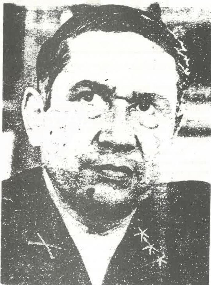
Cnel. José Guillermo García,

"Tanto los hondureños, guatemaltecos y salvadoreños que participan en estas acciones intervencionistas, trabajan bajo un mando único, que comanda el Ministro de Defensa Salvadoreño, Coronel José Guillermo García, reconocido criminal de guerra."