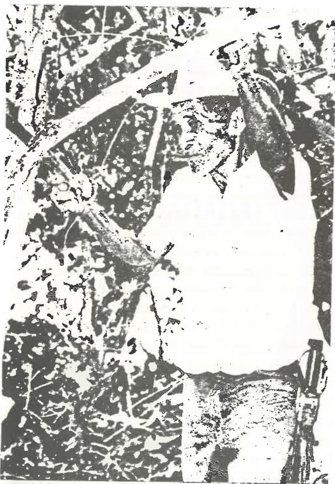
Son cientos los campesinos que en estos momentos están recibiendo la represión más cruel que haya habido en la historia del país.

Particularmente cínica es la afirmación de los actuales gobernantes de que el proceso de reforma agraria no excluye a nadie por razones políticas.