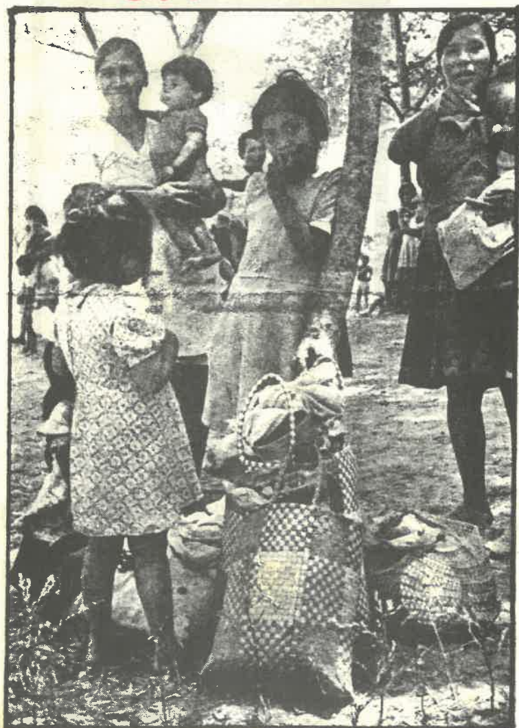
La miseria y el desempleo es uno de los mayores males que cubren a El Salvador. Aquí campesinos llegados a San Salvador hacia donde han huido por la represión.