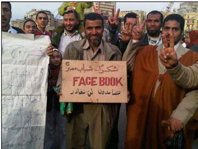
Un manifestante egipcio da las gracias a los jóvenes de Egipto y a Facebook.

Esta foto de un manifestante en Egipto muestra hasta qué punto medios sociales como Facebook han ganado protagonismo, y una imagen positiva, durante las revueltas en la región: