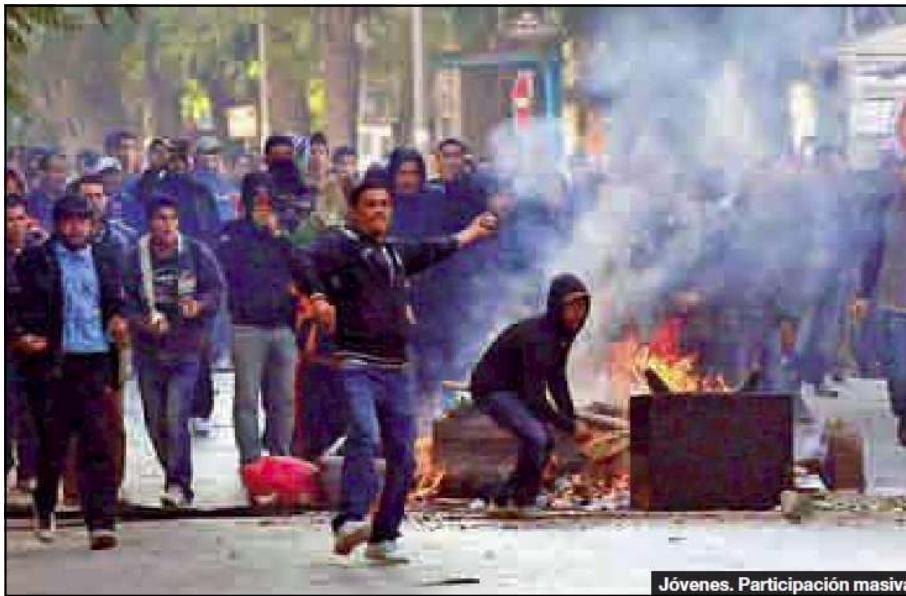
Jóvenes. Participación masiva

Quedaron evidenciados en principio los organismos de seguridad libios al no prever todo lo que sucede hoy en su país. El largo y paciente trabajo de cooptación y organización realizado por los norteamericanos y sus aliados fue cuidadosamente ocultado. Trabajando a mediano y largo plazo. Finalmente los resultados están a la vista. Queda del lado del régimen tener la capacidad de contraatacar de manera audaz e inteligente si quiere sobrevivir. En juego están los inmensos recursos energéticos sobre los que duerme y trabaja diariamente el pueblo libio.