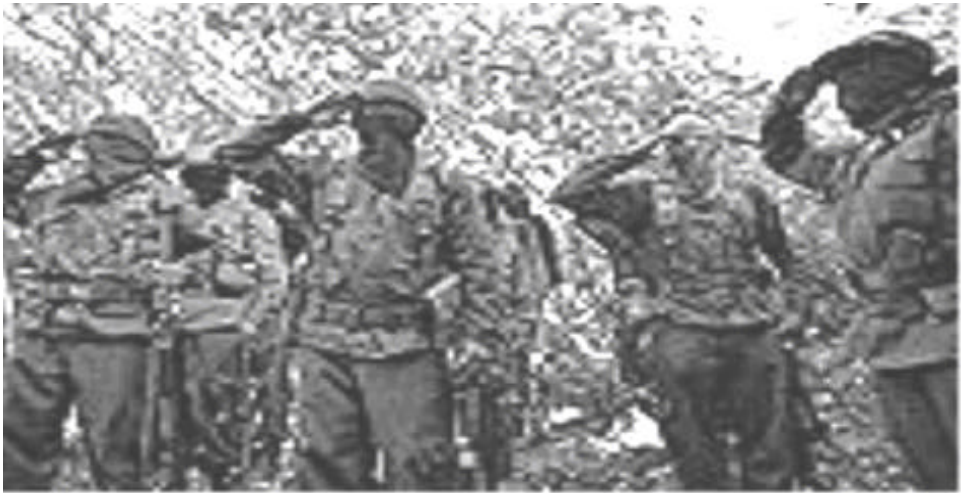
Sierra de Guerrero, diciembre de 2000.

Al pueblo de México. A los pueblos del mundo.