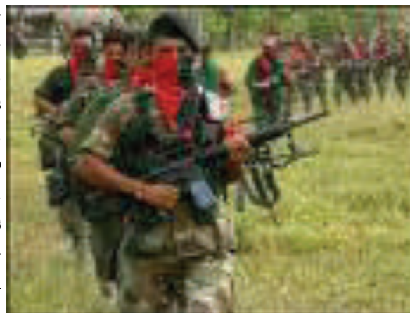
EJERCITO DE LIBERACIÓN NACIONAL

El Frente Bolcheviques del Líbano del ELN informa a la población campesina y cabeceras municipales, que en algunas regiones se vienen cometiendo acciones en contra de la población civil, como son secuestros, extorciones, robos etc., a nombre de nuestra organización. Reiteramos nuestro compromiso con el pueblo de respetar sus bienes, su familia, sus ideas y su trabajo, y que estamos en contra de cualquier atropello que se pueda cometer en contra de la población humilde y trabajadora. Asumimos que en ocasiones tenemos que ejercer justicia contra algunos elementos que afectan la paz y la tranquilidad del campesino. Así reconocemos dos ajusticiamientos realizados por unidades nuestras en el corregimiento de Santa Teresa, y uno en la vereda la Alcancía del municipio de El Líbano, como también uno más en la vereda el arenillo del municipio de Herveo, por robos y atracos. Estas personas venían azotando los municipios mencionados generando un ambiente de intranquilidad entre la población campesina.