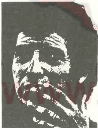
VICTOR JARA: Fragmento de la canción escrita y cantada por él a los compañeros asesinados en la masacre de "Pampa Irigoin", en Puerto Montt.

Puerto Montt, oh Puerto Montt Puerto Montt, oh Puerto Montt Puerto Montt, oh Puerto Montt;