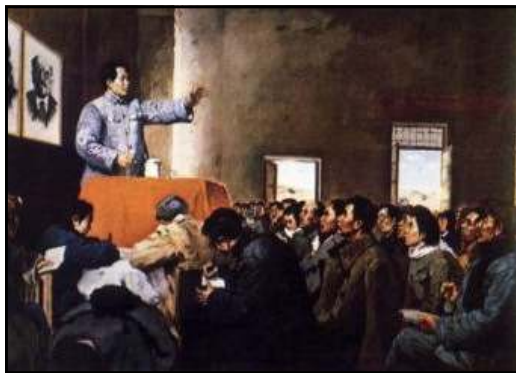
Mao Tse Tung dirigiéndose a los militantes del Partido Comunista Chino, por Luo Kung-Liu, 1950.

"Departiendo con los periodistas asistentes al acto, el Jefe del Estado Mayor, una vez terminada la ceremonia protocolaria que dio inicio a la Tercera Conferencia de Altos Oficiales de los Ejércitos de la Zona del Caribe, se expresó en los siguientes términos: 'Esta