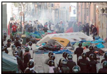
Los profesores oaxaqueños retoman el Zócalo de la Ciudad de Oaxaca.

dejarse de lado en el análisis de la lucha política ya que bajo este contexto, es necesario visualizar las debilidades iniciales del movimiento: había un exceso de confianza de las bases y sus dirigentes por la creencia de la invulnerabilidad del movimiento y de que era prácticamente imposible que Ulises Ruiz se atreviera a ordenar su desalojo. Aparentemente todo marchaba sobre ruedas, pero vino la represión y el magisterio consciente se vio obligado a utilizar la autodefensa de una manera improvisada, sin experiencia y sin organización previa; esta autodefensa producto de la rabia y del coraje culminó posteriormente con una contraofensiva, ahora sí, organizada, con aciertos y defectos; y precisamente en esta contraofensiva se pudo observar que el mayor de los defectos fue que algunos de los liderazgos aparentemente más preclaros y capaces no asumieron una actitud que las bases sí asumieron como nunca antes se había visto en los maestros de Oaxaca.