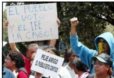
Manifestaciones en defensa del voto en el D. F.

Tal pareciera que la lucha electoral está siendo encauzada hacia la definición de dos posiciones políticas — que no de proyectos económicos antagónicos—, y que en tal sentido la sociedad mexicana está dividida, en base a la adopción de cada uno de esos proyectos políticos, en dos grandes e inconciliables sectores sociales. Pero la lucha de clases no está constituida únicamente por la lucha electoral, aunque, ciertamente, ésta es uno más de los reflejos de aquélla. Al final de cuentas, también la lucha reivindicativa, la lucha social, la defensa y promoción de los derechos humanos, la defensa de los recursos naturales y la promoción ecológica, la lucha por la democratización sindical, la lucha armada, etcétera, forman parte de la lucha de clases. Todas estas manifestaciones de lucha nacidas de la creatividad del pueblo van dándole forma global a lo que es la lucha de clases. Aun cuando ésta, su existencia como tal, sea negada o no quiera ser vista de manera franca y abierta por, por ejemplo, los medios de comunicación masiva —parte fundamental de los medios ideológicos de control hegemónico —, la lucha de clases existe; lo que sucede es que a esos medios de comunicación les conviene mantenerla oculta, apenas latente, indescifrable, incomprensible, “ajena” a la vida cotidiana de los pueblos, fragmentaria, sin mostrar los vínculos existentes entre cada uno de esos fenómenos sociales, sin