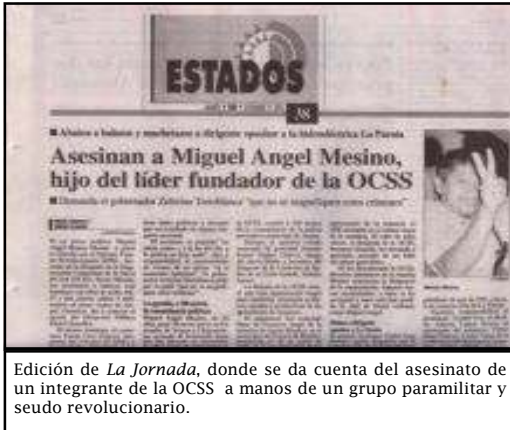
Edición de La Jornada , donde se da cuenta del asesinato de un integrante de la OCSS a manos de un grupo paramilitar y seudo revolucionario.

Desde siempre, la OCSS ha sido una organización vejada por el gobierno, por los caciques y paramilitares de la casta de los Figueroa. Pero no sólo eso. Luego de la masacre de Aguas Blancas, la OCSS sufrió el intento de aislamiento por parte de distintas fuerzas políticas, las cuales sólo querían hacerse cargo de la denuncia de ese crimen artero por el simple prestigio nacional e internacional que ganarían... Cuentan los que saben que cuando la OCSS lo advirtió y rechazó su "ayuda", entonces se le cerraron las puertas de la "solidaridad" de muchos "compañeros"... Luego vino el desprecio general de los partidos políticos... Luego vino la resistencia, la adversidad de luchar contra la corriente, de desenmascarar a Rubén Figueroa... Y al parecer lo lograron. Pero no fue suficiente.