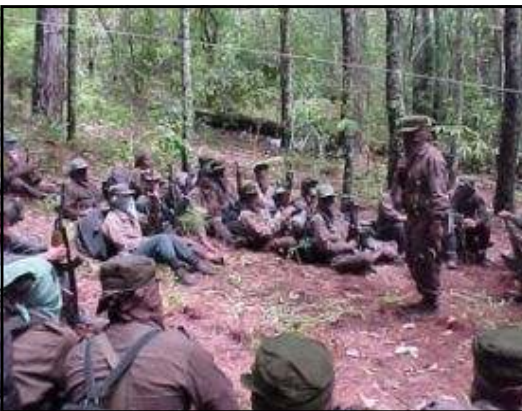
Campamento guerrillero de las FARP.

El "intolerable revisionismo de Marx" no está en el poema anterior sino en la cabeza de quienes no creen que la violencia sea la partera de la Historia y mucho menos la mamá del niño-pueblo sino por el contrario una cosa mala que ciertos revoltosos del barrio le quieren enseñar al cipote sin pensar en los líos que todo ésto nos va a traer con la Policía y la Guardia que hasta van a echar al papá del empleito que tiene en el Gobierno y se acabuchen los frijolitos fáciles y la tranquilidad.