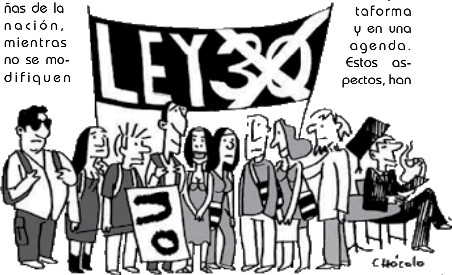
De cada cien universitarios, noventa y nueve van a la marcha y uno se gradúa.

de plataforma y en una agenda. Estos aspectos, han