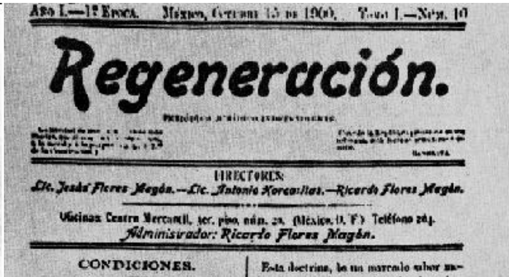
Ejemplar del Periódico "Regeneración"

Ricardo Flores Magón, nació el 6 de septiembre de 1873 en San Antonio Eloxochitlán, Oaxaca (poblado de la Mixteca Oaxaqueña). La familia Flores Magón cambió su domicilio a la ciudad de México en donde Ricardo hizo sus estudios de primaria, preparatoria y la carrera de jurisprudencia, que tuvo que abandonar para dedicarse por completo a la lucha revolucionaria en contra de la dictadura de Porfirio Díaz quien mantenía a México en la más cruel opresión, miseria y en la total falta de libertades políticas.