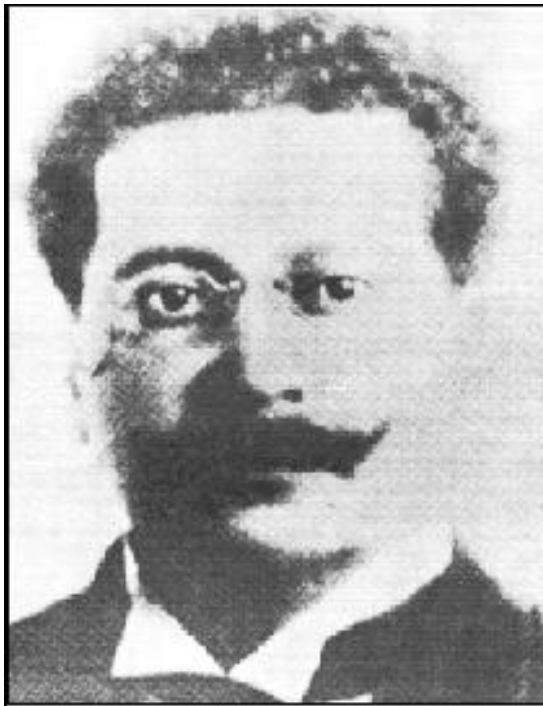
Ricardo Flores Magón