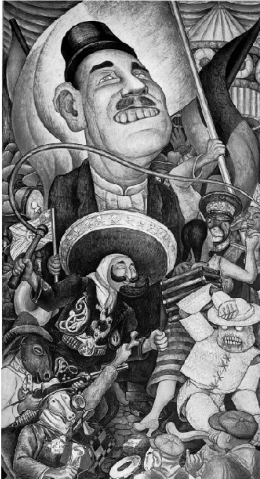
Recordando al muralista mexicano Diego Rivera a 40 años de su fallecimiento

superstición universitaria del fin del socialismo. Pero como es evidente el fracaso del capitalismo que vive en y de las crisis cada vez que una bolsa de valores flaquea lo cual pospone para dentro de veinte años el bienestar de las familias pobres, es necesario organizar la cultura de la resistencia y la réplica que luche ahora, acumule fuerzas y esté dispuesta a seguir hasta la victoria, lo cual requiere combatir al escondido