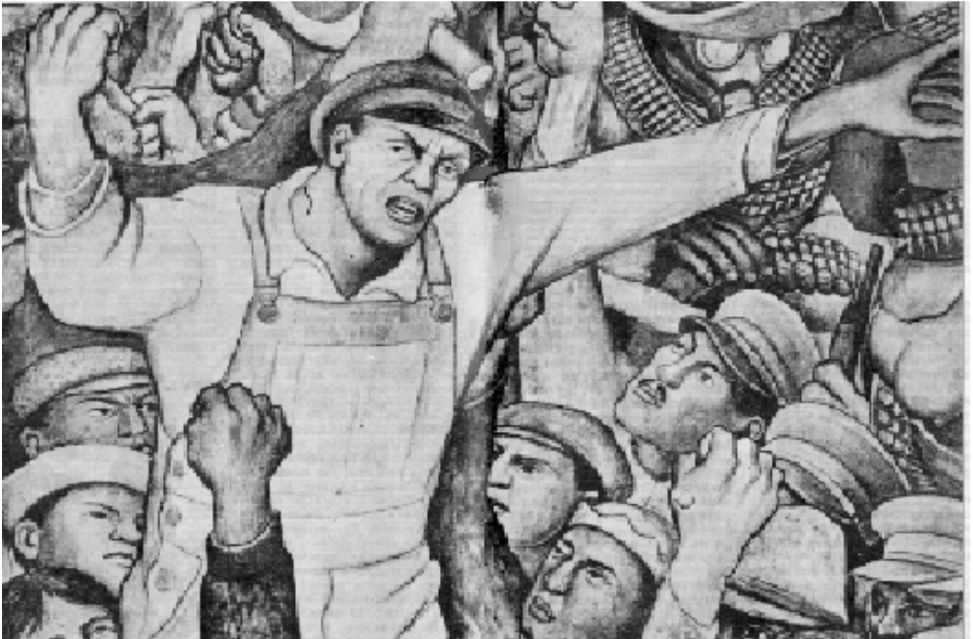
DETALLE DE UN MURAL DE DIEGO RIVERA