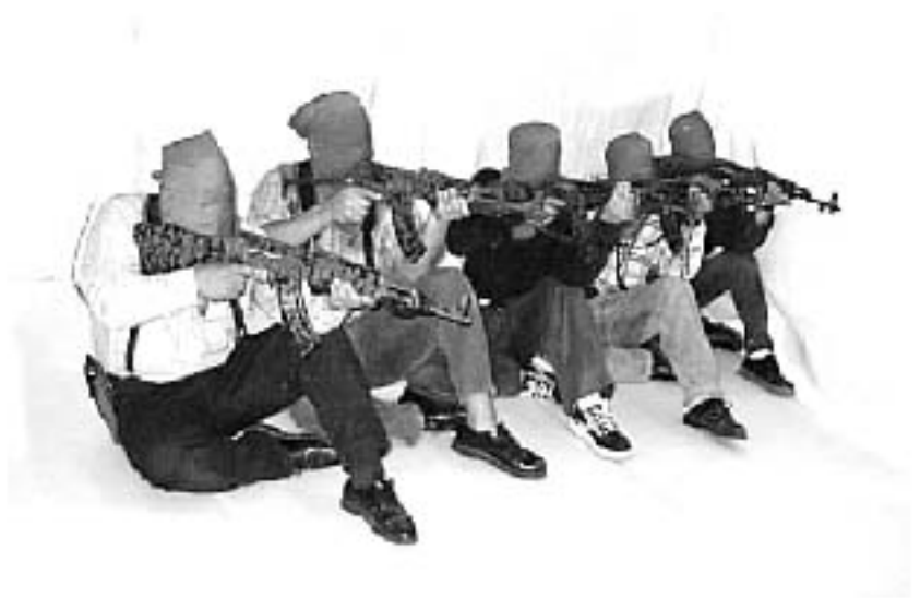
Militantes del partido en entrenamiento militar

El abstencionismo debe ser canalizado hacia la movilización política, hacia la educación y la acción política de masas que conjuntamente con el movimiento armado revolucionario logremos los cambios sociales que el país requiere. Para establecer la democracia se hace necesario implementar la lucha armada y en torno a ella todas las formas de lucha, a pesar de que marxistas vergonzantes y revolucionarios arrepentidos, mercaderes de intelectuales hagan eco de la propaganda imperialista, en el SOCIALISMO esta garantizada la democracia popular.