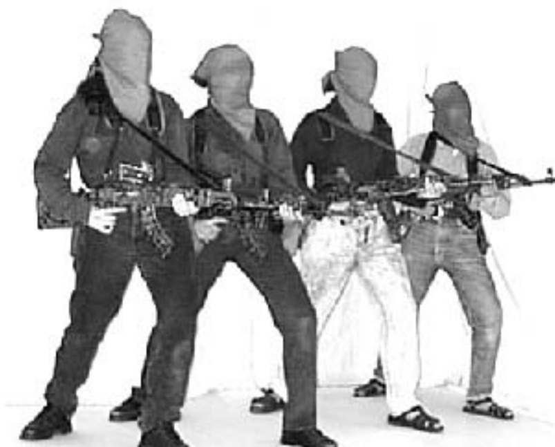
Compañeras militantes del PDPR y combatientes del EPR