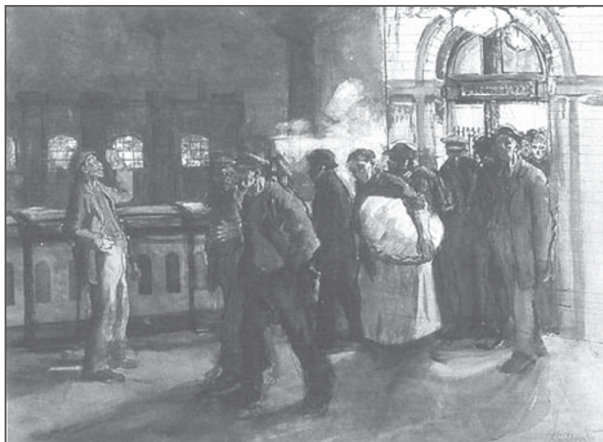
Kollwitz, Obreros 1897

D ebemos celebrar la decisión de la casa editorial Luxemburg de re-editar un texto de la excepcional importancia, teórica y práctica, del ¿Qué hacer? de Lenin. Es evidente que se trata de una iniciativa a la vez oportuna y desafiante. Según Marcel Liebman – autor de un notable estudio sobre el pensamiento político de Lenin que, a treinta años de su publicación original en lengua francesa, continúa siendo una imprescindible referencia sobre la materia– quienes se interesen por estudiar a Lenin tropiezan «con la extrema pobreza de una bibliografía abundante pero generalmente muy estéril» (Liebman, 1978: 9). Una de las razones principales de esta desafortunada situación reside en la inerradicable politicidad de toda la obra de Lenin. Pronunciarse a su favor o en su contra no es una cuestión académica sino un acto de voluntad política. La consecuencia ha sido la constitución de una polaridad cuyos dos extremos son igualmente negativos a la hora de intentar comprender el significado del legado leninista: o bien su sacralización en la Unión Soviética, transformando «una teoría subversiva en un sistema