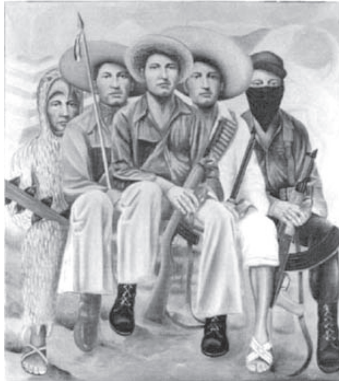
Cuadro: Lucio, Siempre Vivo . Autor: Comandante Insurgente del ERPI Antonio

de 2004 donde ante la presencia de miles de personas con respeto, marcialidad y orgullo marcharon por las calles e hicieron un acto político contando con la presencia de personalidades de la cultura en México, artistas y sacerdotes comprometidos con el pueblo, líderes del movimiento político-social del estado de Guerrero y del país y desde luego con la asistencia de colegas y contemporáneos de Lucio que lo vieron iniciar la lucha y la organización así como sus familiares consecuentes y orgullosos de la obra del Partido de Los Pobres y la infaltable presencia del pueblo de Atoyac y otros lugares del estado de Guerrero y del país.