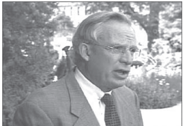
Porter J. Goss, Director de la CIA

En 1965, «coincidió» con Phillips en la estación de la CIA en Dominicana, luego fue destacado en Europa occidental, donde contrajo una rara enfermedad en la sangre que lo hizo abandonar el servicio activo y dedicarse a los negocios y a la política. Goss, quien llevaba ya 16 años en el Congreso y planeaba el retiro, propuso «casualmente» a mediados de este año, una legislación que aumente la autoridad del director de la CIA, sobre un presupuesto de más