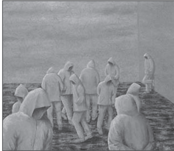
Cuadro: En busca del tiempo perdido, Comandante Insurgente Antonio

Si veo por encima de mi hombro la estela que al paso dejé, la vida que tuve bendigo, cosecho la mies que sembré, ¡ Y soy lo que yo quise ser !