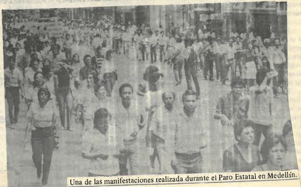
Una de las manifestaciones realizada durante el Paro Estatal en Medellín.

Lo anterior muestra el desprestigio en que ha quedado sumido el gobierno de B.B., la desconfianza que éste se ha ganado y que definitivamente las amplias masas colombianas no luchan ni por el diálogo, ni por la tregua, pues en un país con tantas injusticias, no habrá paz mientras éstas persistan.