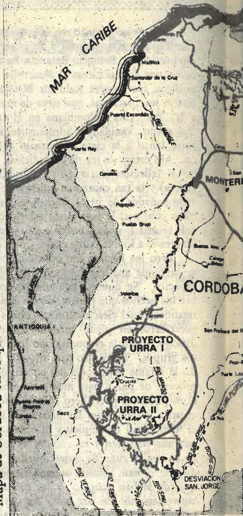
Mapa de Córdoba en el que se destaca la zona de los proyectos Urrá I y Urrá II

río Sinú en los 3 y medio años que dura el llenado del embalse, lo que a su vez afectaría la actividad pesquera de agua dulce y por ende a 15.000 familias que viven de ella, así como también la actividad agrícola, debido a la salinización de los suelos; se presentarán impredecibles modificaciones en el ciclo hidrológico de la región ya que existe el riesgo inmediato y grave de alterar el régimen de lluvias y su clima; se verán desplazadas numerosas especies animales que componen la rica y variada fauna, por desgracia aún no inventariada totalmente; se amenazarán el suministro de agua potable a las poblaciones ribereñas; se profundizará el nivel de las aguas subterráneas; se acabarán las pequeñas pero numerosas explotaciones de oro en el río Sinú; se presentarán problemas en los alcantarillados de las poblaciones y en el agua del río se concentrarán más toda clase de contaminantes que obligarán a emigrar a muchas familias humildes. Y para completar el cuadro, 2.000 integrantes de la comunidad Embera-Katíos deberá ser desarraigada de su sitio, el cual también resultará inundado.