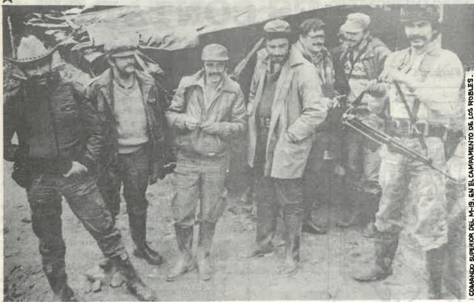
COMANDO SUPERIOR DEL M-19, EN EL CAMPAMENTO DE LOS ROBLES.

EL P.R.T. ASISTE AL CONGRESO DE LOS ROBLES, CAUCA