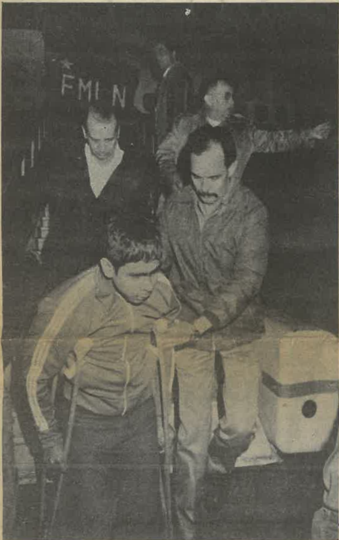
42 lisiados de guerra y 72 sindicalistas que guardaban prisión injustificada en las cárceles del gobierno, obtuvieron su libertad.

Con la liberación de 42 lisiados de guerra, y de 72 sindicalistas y miembros de organismos populares, concluyó el pasado 29 de enero el proceso de negociaciones mantenidas entre el FMLN y el gobierno salvadoreño, al llegar a un acuerdo sobre las condiciones del canje del Coronel Omar Napoleón Avalos y las demandas planteadas por nuestro frente.