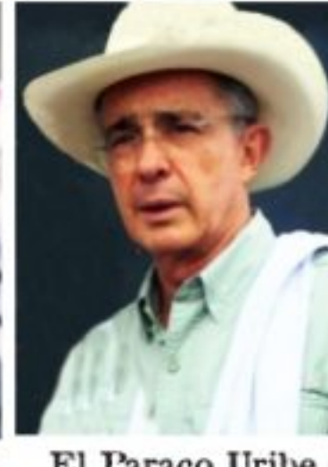
El Paraco Uribe