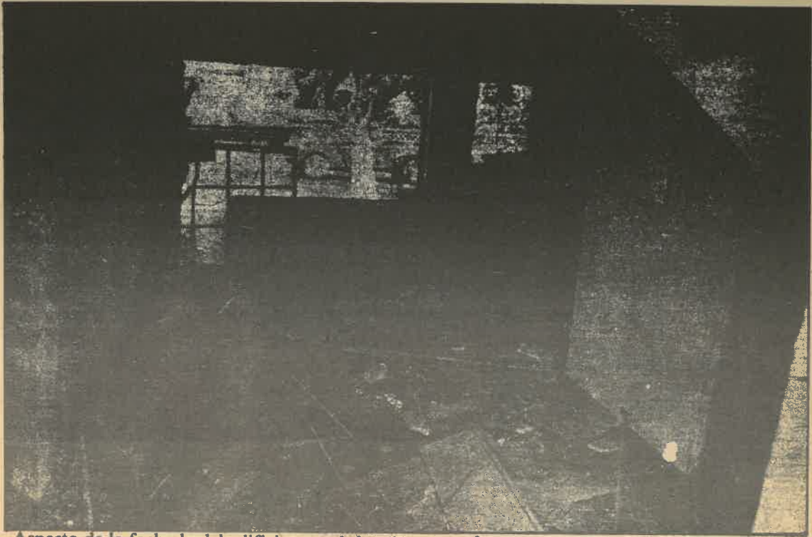
Aspecto de la fachada del edificio que aloja a la Comisión de Derechos Humanos de El Salvador, después del estallido de la potente b6mba cargada de dinamita que fue colocada el pasado 13 de Marzo a la entrada del garage. Los destrozos se calculan en varios miles de col6n6s.

LA COMISION DE DERECHOS HUMANOS DE EL SALVADOR informa a trav6s de los datos que a continuaci6n presentamos, un peque1o panorama de nuestra realidad nacional. En ning6n momento pretendemos que nuestros datos son exact6s; ya que la imposibilidad de obtenerlos en forma completa se debe a la tergiversaci6n noticiosa de parte de las agencias period6sticas y lo m6s importante es que numerosos casos importantes no se reportan por temor a represalias.