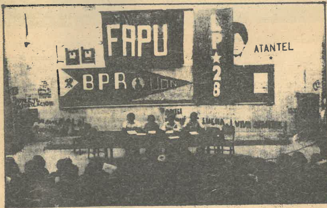
PARO FUE UN EXITO. En conferencia de prensa realizada este día la Coordinadora Revolucionaria de Masas, afirmó que el paro del día lunes había sido un completo éxito. A la vez denunció la represión desatada contra los sectores populares.

Las bombas criminales detonadas en los locales de FENASTRAS y la FSR, el asesinato de trabajadores de STECEL, IMSA, etc., el constante asedio y persecución con bestiales hechos entre los que destaca el asesinato masivo de ONCE sindicalistas de FENASTRAS en Santa Ana, son datos concretos del más inhumano genocidio cuyos responsables, la Junta Militar Democristiana, tendrán que rendir cuentas un día no muy lejano al Poder Popular.