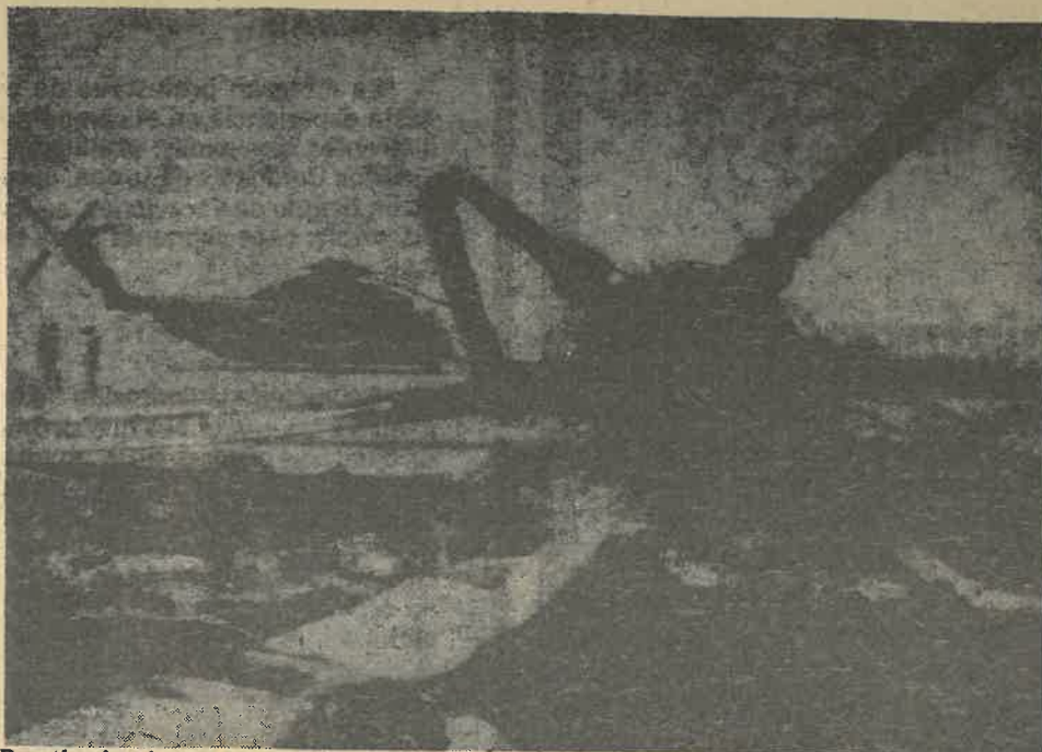
Para los iraníes esos restos de uno de los helicópteros que se destruyó en el desierto de Tabas son parte de su orgullo. Para los norteamericanos, una pesadilla sobre la que cifrarán nuevos esfuerzos para liberar a sus ciudadanos.