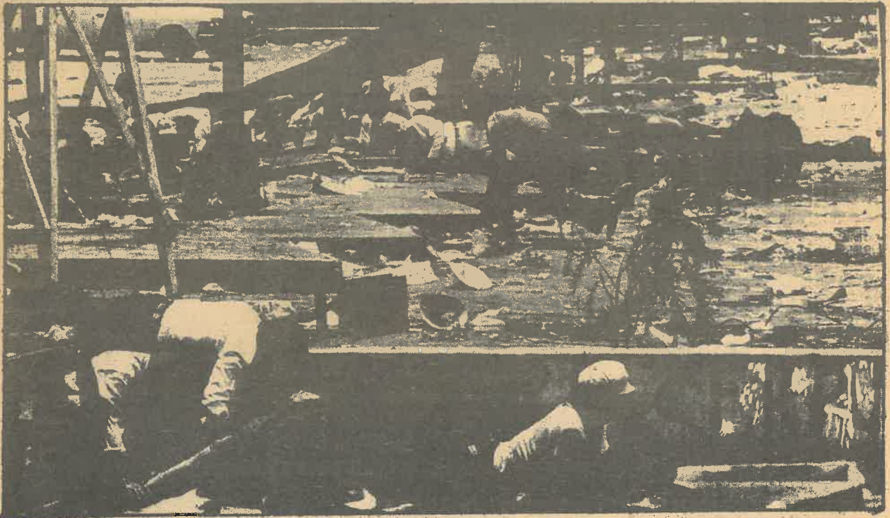
Con arma corta, un miembro de los dispositivos de auto-defensa de la Coordinadora de Masas, se mantiene espectralmente frente al enemigo.

El reconocimiento de beligerante implica el reconocimiento, por los estados extranjeros de que dentro de un país determinado existe una situación de GUERRA CIVIL; ésto hay que demostrarlo con abundante documentación. Además, doctrinalmente se considera que cuando hay cierto grado de fuerza de resistencia, adquirido por una masa de población empeñada en una guerra (de Liberación) da a esta población el derecho a ser tratada como beligerante.