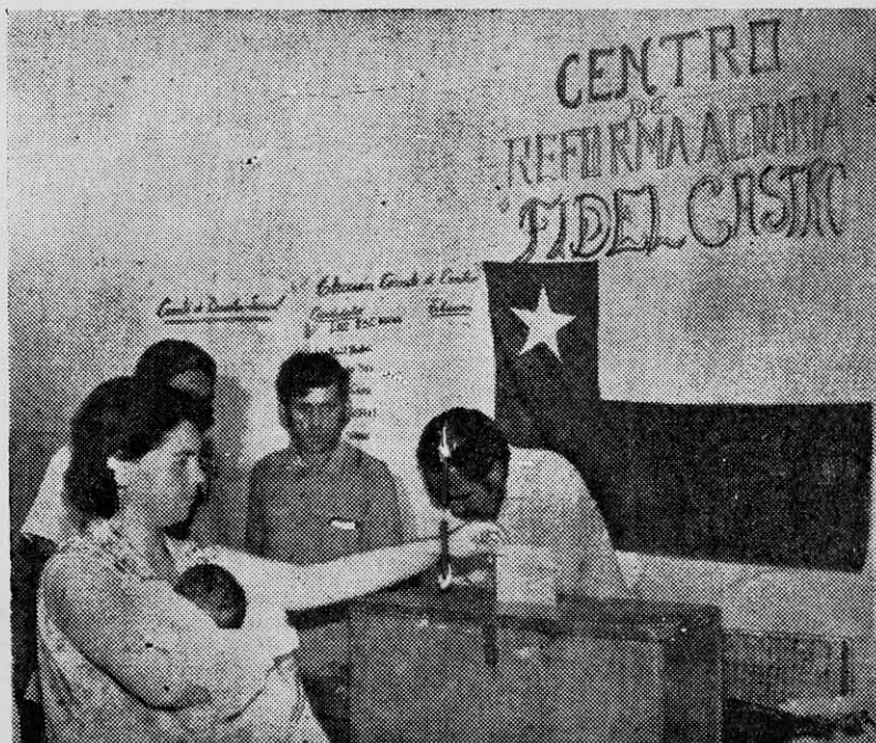
LOS CAMPESINOS también luchan por crear poder popular.

"Frente a este Estado capitalista está surgiendo el poder popular, los Comandos Comunales de Trabajadores, que es y debe ser absolutamente contradictorio y alternativo como base de un nuevo orden, al poder burgués: y no cabe ninguna posibilidad de subordinarlo, por el contrario, los Comandos Comunales se forman en una lucha abierta con el aparato estatal burgués.