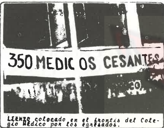
LIENZO colocado en el frontis del Colegio Médico por los egresados.

ORGANISMOS DEPENDIENTES, SEGUIRÁN GENERANDO MÁS CESANTÍA Y MISERIA Y EMPEORANDO ASÍ LA ATENCIÓN Y ASISTENCIA MÉDICA AL CONJUNTO DEL PUEBLO, CONVIRTIENDO CADA VEZ MÁS EL DERECHO A LA SALUD EN UN PRIVILEGIO EXCLUSIVO DE LOS PATRONES Y GORILAS.