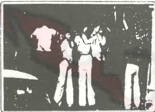
Manifestantes en la puerta de la Catedral con sus rostros cubiertos para evitar ser identificados por la represión.

CON EL FIN DE ELEVAR CUALITATIVAMENTE LOS NIVELES DE COMBATIVIDAD DE LA RESISTENCIA Y MOSTRAR LOS CAMINOS DE COMBATE DE LAS LUCHAS POPULARES, EL COMANDO ANSELMO RADRIGÁN DEL MIR COPÓ MILITARMENTE UN MICROBUS DE RECORRIDO Y SE DIRIGIÓ A LOS OCUPANTES DEL VEHÍCULO, PROVENIENTES DE SECTORES POPULARES DE LA COMUNA DE PUDAHUEL, A QUIENES EXPLICÓ EL SIGNIFICADO DE CLASE DEL DÍA INTERNACIONAL DE LA MUJER Y EL CONTENIDO POLÍTICO DE LAS ACCIONES DE PROPAGANDA ARMADA.