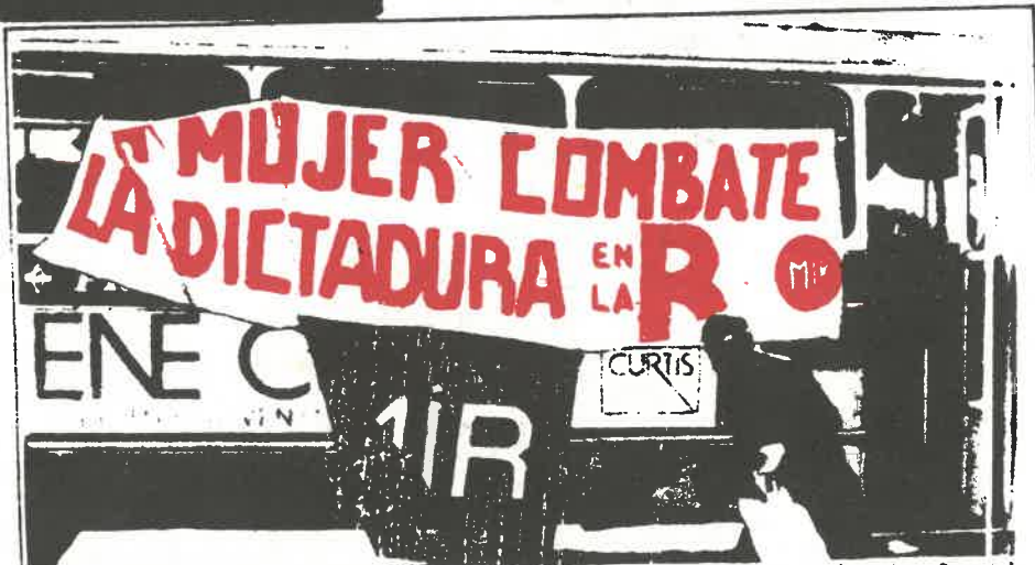
A las 16 horas del día 8 de marzo, Día Internacional de la Mujer, un Comando del MIR copaba militarmente esta micro para dar a conocer al pueblo el contenido de clase de esta jornada de lucha y los objetivos políticos de la Propaganda Armada. En la foto, un militante del MIR termina de colocar lienzos.