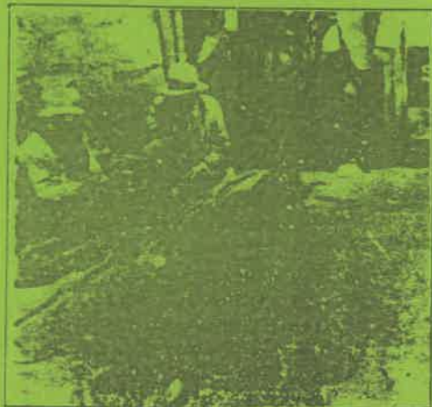
La Guerra Sucia se institucionaliza.

El MRTA llama a todos los sectores de la izquierda, a todo el pueblo a forjar una unidad en defensa de sus verdaderos intereses históricos e inmediatos, a forjar una unidad en el combate y para la revolución, una unidad contra el crimen, el hambre y el entreguismo.