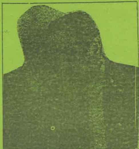
Recibiendo la posta para continuar reprimiendo al pueblo.

Esta crisis generalizada toca con fuerza cada vez mayor las propias estructuras políticas del Apra; pero es importante señalar que en medio de esta crisis van apareciendo elementos nuevos y positivos. A la contienda de cúpula por el reparto del poder y la sucesión que ya tiene algunos años, se enfrenta hoy con fuerza la protesta juvenil de quienes ingresaron al Apra creyendo en las promesas electorales y las ideas primigenias y hoy sienten solo haber sido usados y asumen posiciones cada vez de mayor enfren-