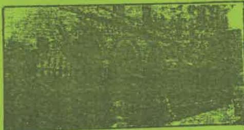
Local del Seminario ubicado entre Sucre y la Av. La Marina tomado por el MRTA

13: Con motivo de la llegada del Papa se colocaron más de 31 banderas del Movimiento Tupacamarista en los distritos de Jesús María, San Borja, San Juan de Lurigancho, Independencia, San Isidro y San Luis, entre otros y muchas de ellas con cazabobos para que no sean retiradas por las fuerzas represivas.