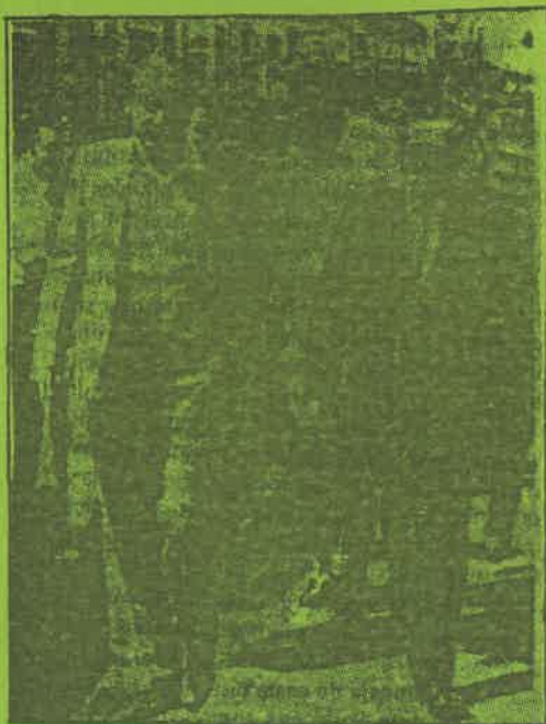
Tramitación del logano contra el p...

Si este personaje puede confundir a importantes sectores de la población es gracias a que toda la derecha a puesto sus medios de comunicación a su disposición, y debido a que en IU cuenta con quienes temen en realidad una auténtica revolución, por eso prefirieran que el cambio pudiera surgir (ilusamente) desde sus escaños parlamentarios, lo que permite a Barrantes que teniendo una aparente minoría arribona y va obligando a las cúpulas partidarias a aceptar su candidatura como la única alternativa "ganadora". Barrantes al formular su propuesta de gobierno de "unidad nacional" no está haciendo otra cosa que avisar que usará a IU para llegar al gobierno pero que una vez desde allí gobernará para la burguesía.