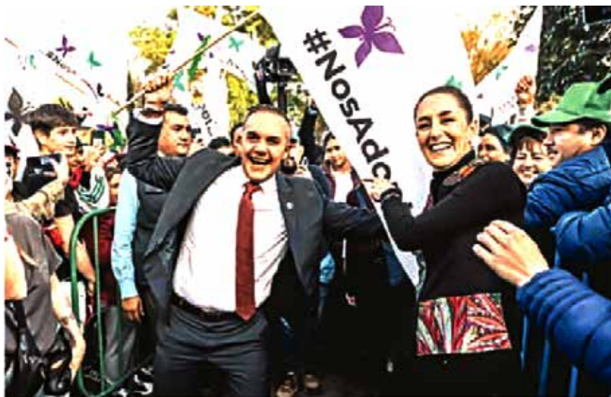
Claudia Sheinbaum “adoptando” a Adrián Rubalcaba, ahora expriista y alcalde de Cuajimalpa, CDMX

Desde Morena todo brote de inconformidad social, crítica al régimen y voluntad popular de combatir, es canalizado a través de los rieles de la democracia burguesa, la cual funciona como la válvula de escape para disipar la inconformidad social y cooptar las conciencias críticas al régimen.