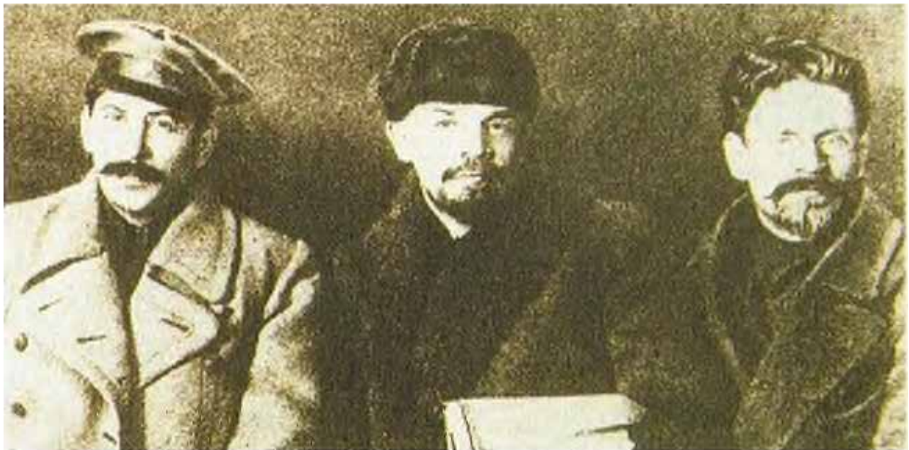
Stalin, Lenin y Kalinin, dirigentes comunistas de la revolución bolchevique

E l pasado 21 de enero se cumplieron 100 años del fallecimiento de Vladímir Ilich Uliánov, más conocido por su nombre revolucionario: Lenin, el que pertenece al río Lena. A un centenario de su muerte es necesario analizar las aportaciones teóricas y prácticas de este revolucionario ante la agudización de las contradicciones capitalistas que vivimos.