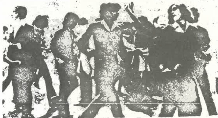
LECCIONES Y TAREAS QUE ENAHAN DE 1978

No tenemos más fuerzas que éstas, que las propias. No tenemos más seguridades que las que nos dan la fe en el futuro del hombre y la certeza del triunfo del socialismo.