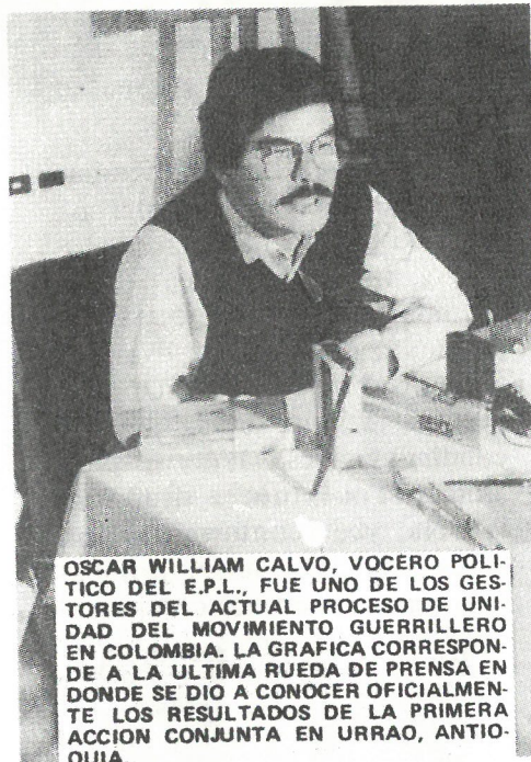
OSCAR WILLIAM CALVO, VOCERO POLITICO DEL E.P.L., FUE UNO DE LOS GESTORES DEL ACTUAL PROCESO DE UNIDAD DEL MOVIMIENTO GUERRILLERO EN COLOMBIA. LA GRAFICA CORRESPONDE A LA ULTIMA RUEDA DE PRENSA EN DONDE SE DIO A CONOCER OFICIALMENTE LOS RESULTADOS DE LA PRIMERA ACCION CONJUNTA EN URAAO, ANTIOQUIA.

La Unidad para la lucha es una salida para los momentos actuales. Unidad sobre bases revolucionarias y lucha decidida y potente contra nuestros enemigos, son derivados de nuestra última sesión plenaria del Comité Central del Partido y del Estado Mayor Central del E.P.L.